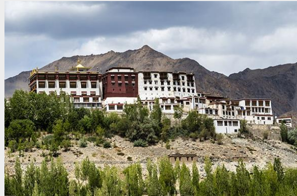
วัดพะยัง (Phyang Monastery)