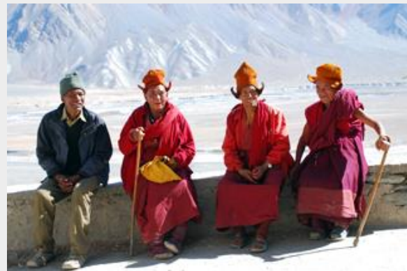
พระลามะที่ชันสการ์

วันนี้ไปเที่ยววัดสำคัญๆ ที่อยู่ก่อนถึงเมืองพาดุม (Padum)