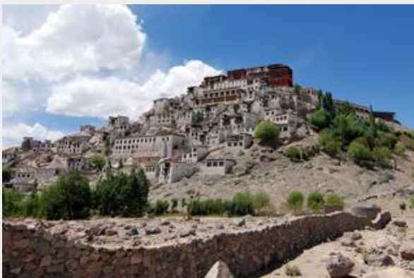
วัดธิคเซย์ (Thiksey Monastery)

แล้วไปต่อที่ วัดธิคเซย์ (Thiksey Monastery) เป็นวัดที่สวยงามที่สุดของลาดักห์ อยู่ในนิกายเกลดปา ภายในวัดมีองค์พระศรีอารยเมตไตรย์ ซึ่งชาวพุทธสายมหายานเชื่อว่า เป็นพระโพธิสัตว์องค์ต่อไป ที่จะคอยช่วยเหลือมนุษย์