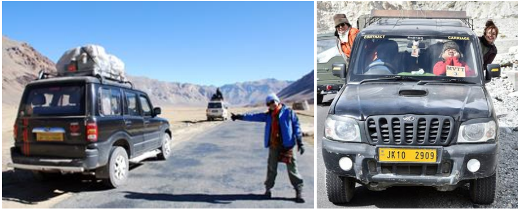
ใช้รถ Mahindra Scorpio *นั่งคนละ 4 คน (นั่งรวมกับเพื่อนที่พักห้องเดียวกัน เก็บกระเป๋าบนหลังคา) เบาะหน้า ข้างคนขับ 1 คน ||||| เบาะกลาง หลังคนขับ 2 คน ||||| เบาะท้าย 1 คน