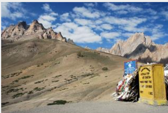
วิวสวยๆจาก Fotula Top

แวะที่ Chamba Statue ที่นี่มีพระพุทธรูปพระศรีอารยเมตไตรย์ แกะสลักอยู่บนภูเขาหิน จากรูปแบบของการแกะสลักสันนิษฐานว่าสร้างขึ้นเมื่อประมาณ 800 ปีก่อน โดยลูกศิษย์ของ ล็อดซาวา ริงเช็น ชังโป พระสงฆ์ชาวทิเบตที่สร้างวัดไว้ในหุบเขานี้มากถึง 108 วัด แวะกราบนมัสการ ขอพรให้เดินทางปลอดภัย