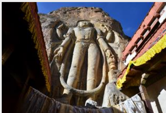
พระศรีอารยเมตไตรย์ บนผาหิน

เดินทางถึงเมืองการ์กิล ไปเดินตลาด หจกอาหารอร่อยๆ กินอาหารกลางวัน แล้วเดินทางต่อ