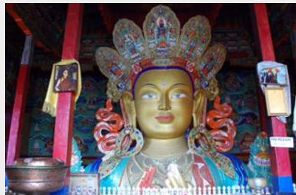
พระศรีอารยเมตไตรย์ วัดธิคเซย์