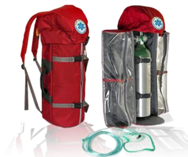
O2 ออกซิเจน ติดรถเป็นกองกลาง 1 แท็งค์ กรณีฉุกเฉิน