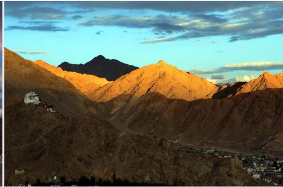
วิวยามพระอาทิตย์ตก มองจาก Shanti Stupa

เที่ยวเสร็จ ถ้ามีเวลาเหลือ ให้เวลาอิสระ เดินเล่น เพลินๆ พักผ่อน เที่ยวตลาด ดูนเสมียง ตามอัธยาศัย จากนั้นกลับโรงแรมที่พัก กินอาหารเย็น แล้วเข้านอน