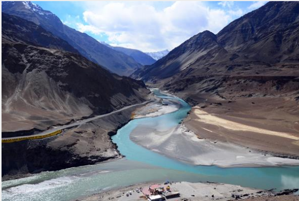
แม่น้ำสินธุ พบ แม่น้ำชันสการ์ (Nimmu)

ระหว่างเส้นทาง แวะถ่ายรูปที่ Nimmu เป็นจุดที่แม่น้ำสองสาย คือ แม่น้ำสินธุ (Indus River) และ แม่น้ำชันสการ์ (Zaskar River) ไหลมาบรรจบกัน