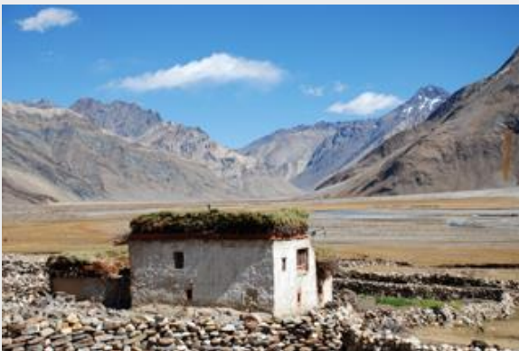
บ้านเรือนระหว่างทาง

เดินเที่ยวชมบรรยากาศสบายๆในหมู่บ้าน สัมผัสวิถีวัฒนธรรมชาวบ้าน การทำนา การเลี้ยงสัตว์ เก็บกระเป๋ารoad ออกเดินทาง *แวะเที่ยวไปเรื่อยๆเช่นเคย