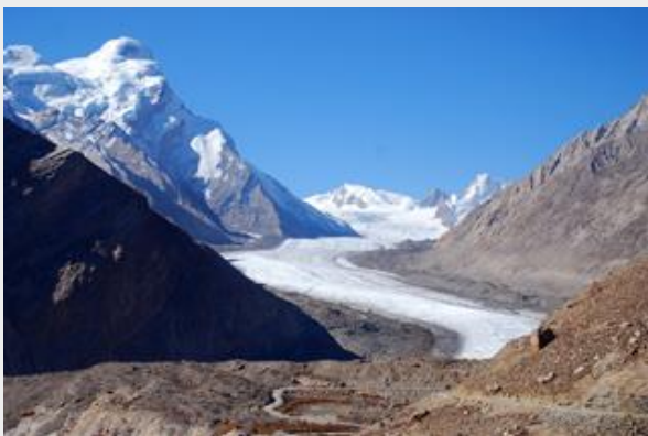
ธารน้ำแข็งดรินดรุง (Dran Drung Glacier)

ตื่นเช้า- กินอาหารเช้า เก็บกระเป๋าขึ้นรถ ออกเดินทาง * แวะเที่ยวไปเรื่อยๆเช่นเคย