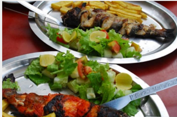
ปลาเทราต์รสเด็ด รออยู่ที่มะนาลี