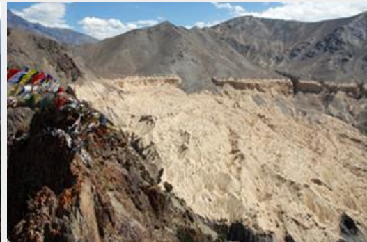
Moon Land หุบเขาโลกพระจันทร์