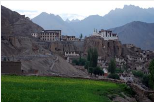
Lamayuru Gompa วัดลามายูร์

ด้วยทำเลที่ตั้งของลามายูร์นั้นเคยเป็นทะเลสาบมาก่อน ปัจจุบันท้องทะเลสาบแห้งสนิทเห็นชั้นดินที่ธารน้ำแข็งกัดเซาะเป็นร่องลึก มองเห็นเป็นชั้นๆสวยงามแปลกตา จนถูกขนานนามว่า Moon Land หรือ โลกพระจันทร์