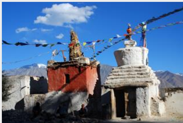
วัดและสถูปเจดีย์ พบได้ทั่วไป