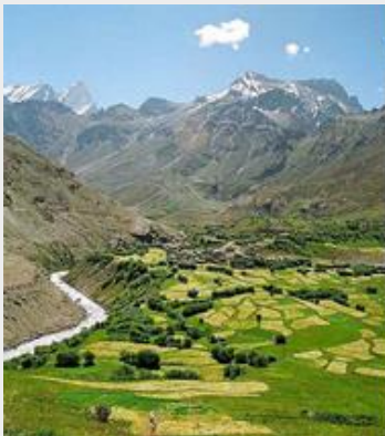
พระพุทธรูปแกะสลัก ที่ Suru Valley

เป็นวัดพุทธศาสนาแบบวัชรยานของทิเบต ในสายนิกาย เกลุดปะ (หมวกเหลือง) ตามคำจารึก วัดแห่งนี้สร้างโดยกษัตริย์แห่งลาดักห์ แม้ว่าที่ตั้งอยู่ในพื้นที่ Suru Valley ซึ่งเป็นชุมชนชาวมุสลิมในปัจจุบัน แต่ที่นี่ก็เป็นส่วนหนึ่งของวัฒนธรรมชั้นสการ์