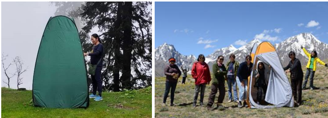
เต็นท์ห้องน้ำของเรา ปลอดภัยจัดได้ทันที