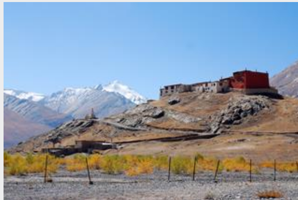
วัดรังดุม

เดินทางถึง หมู่บ้านรังดุม (Rangdum Village) เข้าสู่ที่พัก กินอาหารค่ำ แล้วเข้านอน